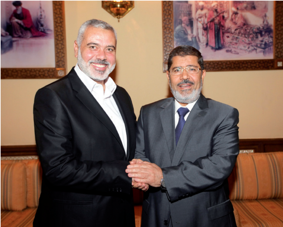
Haniyeh et Morsi

Les bouleversements politiques au Proche-Orient amènent de nouvelles configurations de pouvoir, avec des conséquences également pour les organisations terroristes actives dans la région. Le journaliste israélien Guy Bechor a écrit plusieurs commentaires sur cette thématique.