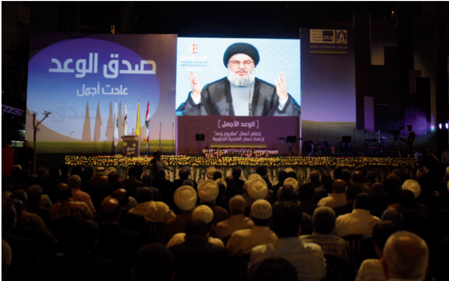
Le Hezbollah est une organisation commanditée par l'Iran et menant des activités terroristes. Image : Hassan Nasrallah, chef du Hezbollah

Tzipi Livni, ex-ministre israélienne des Affaires étrangères, prend régulièrement position dans les médias sur des thèmes brûlants. Voici un article qu'elle a rédigé il y a quelque temps.