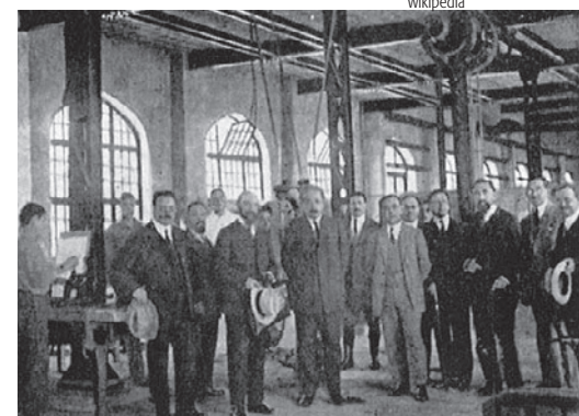
Albert Einstein au Technion en 1925 environ

Les difficultés des commencements appartiennent depuis longtemps au passé. En cette année du centième anniversaire, le Technion compte 12 856 étudiants, alors que la toute première année, il n'en comptait que 6. On y propose des cycles d'études au niveau baccalauréat (bachelor) et au niveau diplôme (master) dans tous les domaines techniques, et les doctorants sont également accompagnés au début de leur carrière académique. D'innombrables personnalités éminentes ont fait leurs études au Technion. Les plus célèbres sont bien sûr les 3 lauréats d'un prix