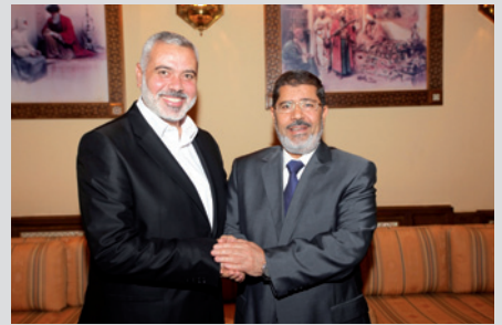
Nouvelle réalité pour les terroristes également. Page 10