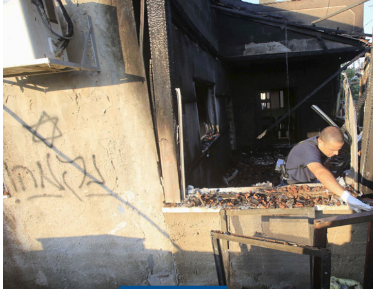
ON A DÉCOUVERT UN TEXTE INCENDIAIRE EN HÉBREU – UNE ÉTOILE DE DAVID ET LE MOT « VENGEANCE » – GRIFFONNÉ SUR UN MUR JUSTE À CÔTÉ DE LA MAISON DE CETTE FAMILLE PALESTINIENNE

Israël recourt à différents moyens juridiques contre le « terrorisme juif ». On a procédé aux premières arrestations et les suspects sont plus étroitement surveillés.