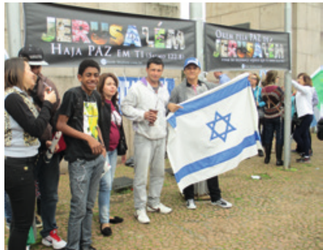
Manifestation pour Israël au «Parque Farroupilha» à Porto Alegre, Brésil.