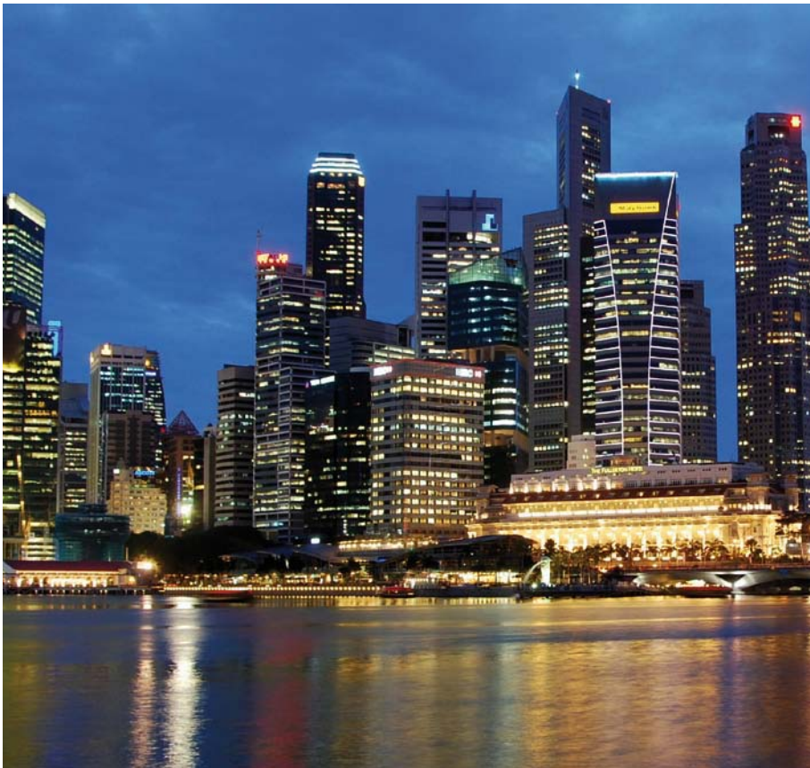
Les pays asiatiques qui hébergent une importante partie des dépôts d'épargne du monde entier sont déjà en train de développer leurs propres centres financiers. Photo: Singapour

Dans les hautes sphères des économistes américains, plusieurs sont d'avis que le poids du dollar américain est en train de fondre sur les marchés des capitaux mondiaux. Joseph Stiglitz, universitaire de renom et ancien économiste en chef de la Banque mondiale, dit ceci: